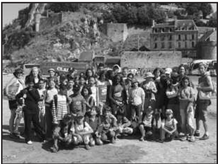
au Mont Saint-Michel

Et voilà nous sommes prêts pour rentrer à Strasbourg, revoir nos parents pour leurs raconter nos vacances.