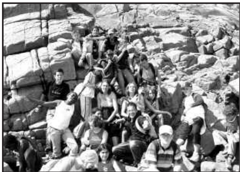
à l'île de Bréhat