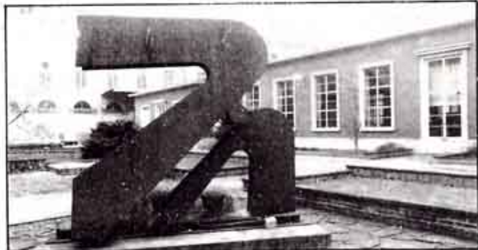
Dans la cour de la Manufacture, le sigle de la SEITA.