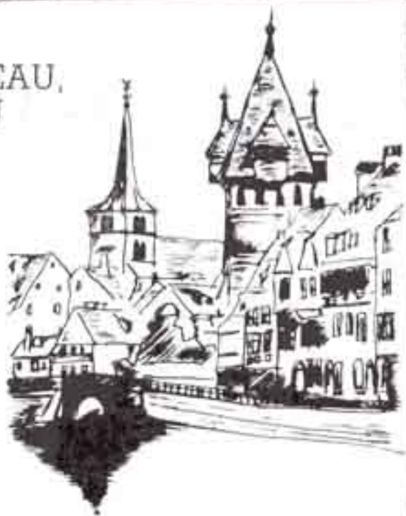
Silhouette de la Tour d'Or (d'après une photo de Charles Winter).

"Le quartier de la Krutenau est un village où il fait bon vivre...", entend-t-on dire de nos jours. Certes, les habitants de la Krutenau connaissent des difficultés, et n'ignorent pas les incertitudes qui pèsent sur l'avenir du quartier (notamment en matière d'aménagement). Il n'en reste pas moins que nombre d'entre eux apprécient de vivre dans un quartier doté d'une personnalité et d'un charme propres.