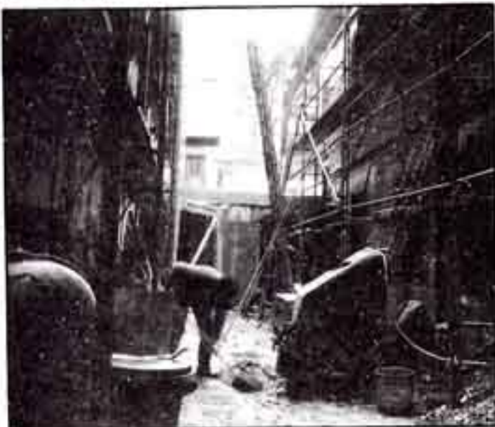
Quai des Pêcheurs