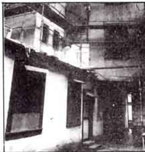
7, rue de l'Hôpital militaire